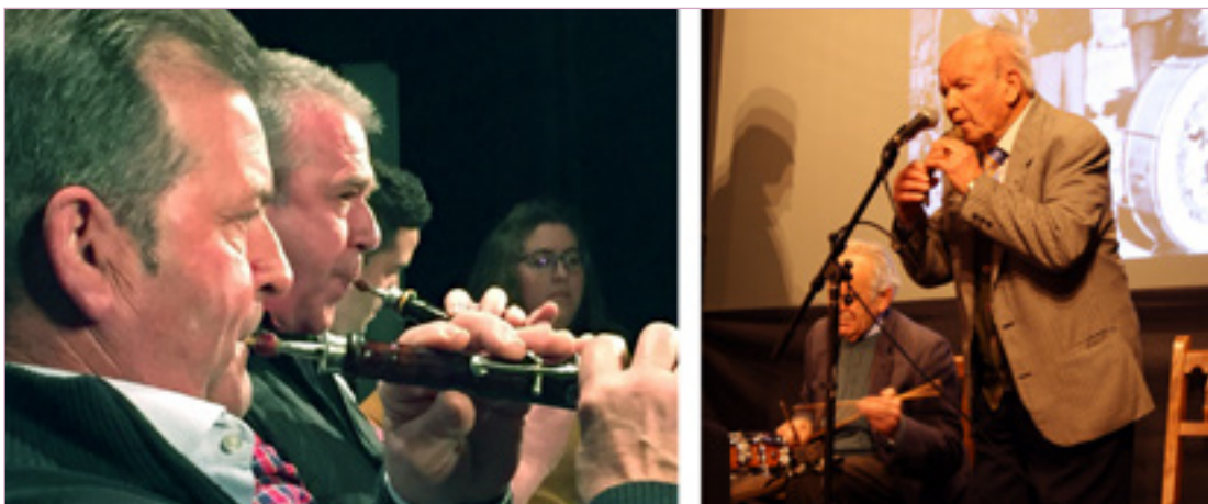
Cuerno, dulzaina y tamboril, instrumentos presentes en el IX Ciclo de Otoño.

Su primer jornal lo ganaron en Valleruela de Pedraza, 10 pesetas para los dos. Algo más les pagaron en Rebollo, 150 pesetas para los tres hermanos tocando en una boda que duró tres días. A partir de ahí ampliarían su radio de acción, con actuaciones en diferentes localidades -de un toque solía salir otro- amenizando fiestas, romerías y eventos variados.