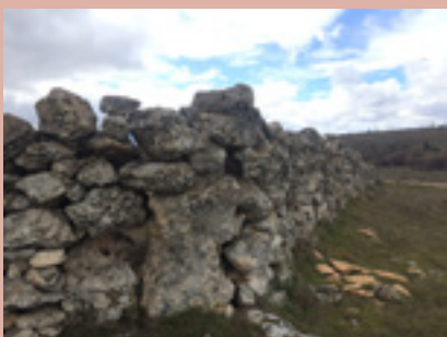
Fotografía de portada: Valla de piedra construida en seco, localiza- da en el término de Arcones. Foto: E. Maganto, abril 2018.