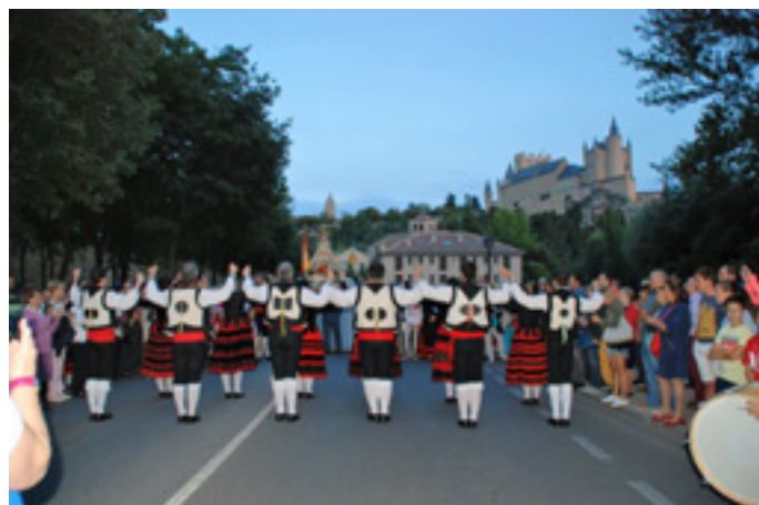
Ilustración 6. Grupo Emperador Teodosio adornando la bajada de la Fuencisla. Septiembre 2016.

En Segovia capital 11 los grupos se van a caracterizar más aún si cabe, por una mezcla de repertorios de distintos puntos provinciales, en una gran mayoría heredados de los repertorios de Sección Femenina: entradillas; paloteos (como la Jota Paloteada de Fuentepelayo, la Reverencia de Torreiglesias, la Alegre, la Retirada, el Trébol, y el Taracatrún de Armuña, o La Salve y Las Agachadillas de Gallegos); danzas procesionales (como La Revolvera, La Niña y La Cruz de Carbonero, El Arco de Fuentepelayo o