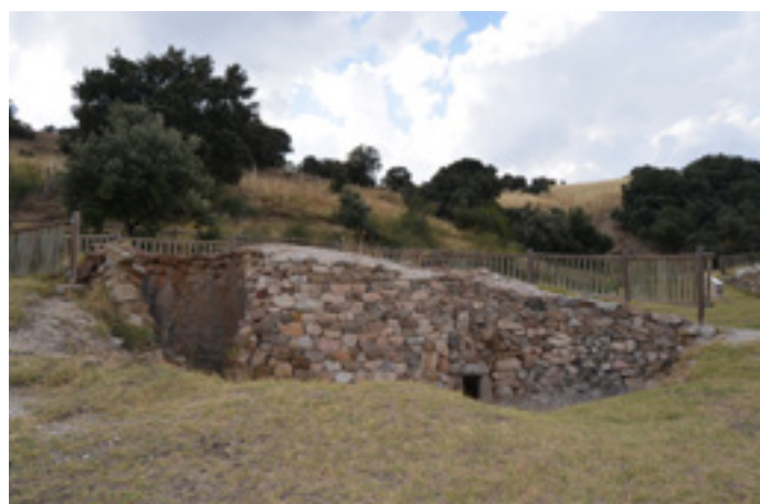
Horno de cal construido con la técnica de piedra en seco, reconocida por la UNESCO como Patrimonio de la Humanidad recientemente. Vegas de Matute. Parque arqueológico Hornos del Zanco.