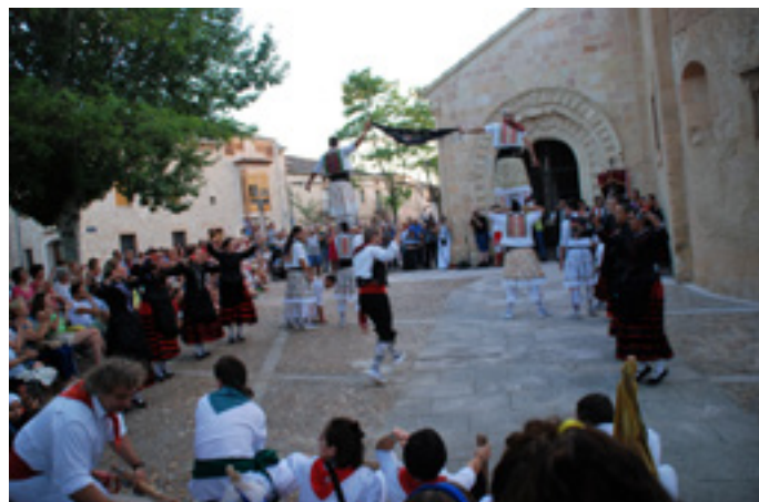
Ilustración 5. Danzantes de San Pedro ante la visita de la Coordinadora de Ball de Bastons de Cataluña. Julio 2017.

Habiendo decaído las Cofradías como estructura social para la danza, sin que las mayordomías hayan recogido el testigo, los asociacionismos empiezan a ser una de las estructuras sociales sustento para la danza, pero ¿danza o baile? Frente a estos grupos de danzantes con sus danzas, los grupos también denominados de danzas, pero que a nuestro parecer, no lo son, tal y como hemos aclarado en líneas anteriores.