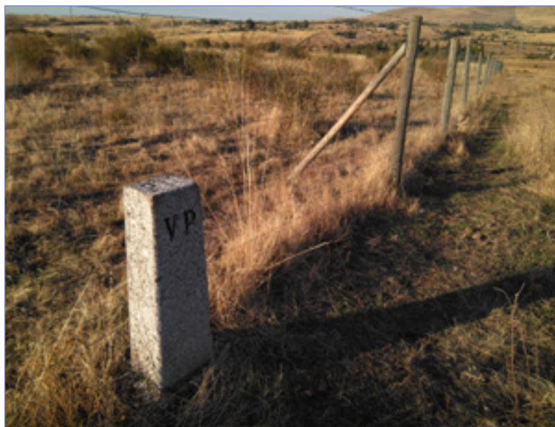
Hito señalizador de los límites de la Cañada Real Soriana Occidental, cerca del embalse del Pontón Alto.

Ingeniero de Montes. Licenciado en Antropología. Profesor-tutor del Centro Asociado de la UNED en Segovia.