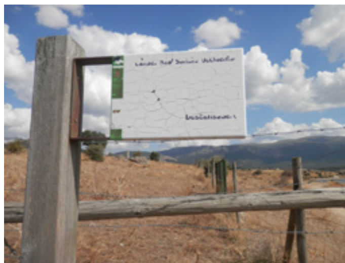
Acceso al descansadero de Gamones, en Palazuelos de Eresma, con señalización un tanto deteriorada.