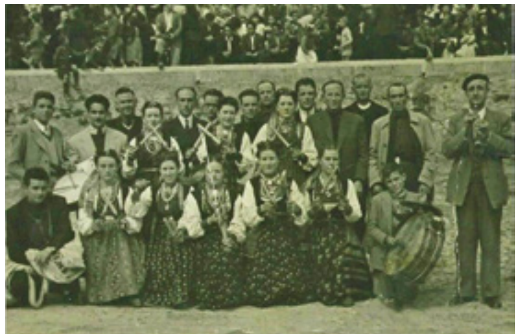
Ilustración 1. Danzantes de Arcones en 1947. En uno de los concursos celebrados en Santa María la Real de Nieva.

Hemos de ser conscientes de que en la mayoría de los casos en los que los tablados, escenarios y demás formatos se convierten en lugar de visibilización de un espectáculo de “baile y danza tradicional”, ese espectáculo se basa mayoritariamente en recreaciones coreográficas estereotipadas y geometrizadas, alejadas de los códigos propios de la tradición. Por tanto el problema no es la espectacularización del patrimonio, sino que lo que se sube a un escenario, no es patrimonio.