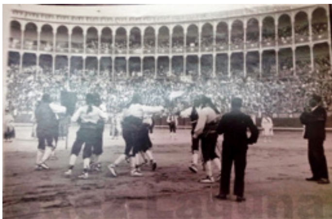
Ilustración 3. Danzantes de Turégano. Plaza de Toros de Madrid, 1929.

Será en el año de 1914 cuando músicos, danzantes y bailadoras de Abades se desplazaron hasta Londres para participar en la Feria de Turismo Sunny Spain , un encuentro anglo-español organizado por el Marqués de la Vega Inclán y Claquer, a la cabeza de la Comisaría Regia del Turismo y la Cultura Popular creada en 1911, con el objetivo de lograr la llegada de turistas ingleses a nuestro país. Y allí estuvo Abades con el dulzainero Paulino Gómez "Tocino" y otros dos músicos -el redoblante Mariano Llorente y José Moreno "Mangango"-, 8 danzantes y su zorra y 8 mujeres bailadoras, junto con los maragatos, leoneses, los charros salmantinos, los zamoranos, los valencianos, los sevillanos o una tuna en los desfiles de "bailes del país" por los jardines del barrio Earl's Court y en el "Empress Hall".