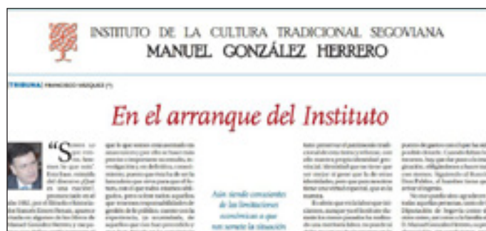
13 de enero del 2013. Primer artículo periodístico del IGH, firmado por F. Vázquez, Presidente de la Diputación de Segovia.

Francisco Vázquez, Presidente de la Diputación de Segovia, quiso expresar personalmente y por escrito las razones de la denominación del Instituto de la Cultura Tradicional "Manuel González Herrero", en el primero de los más de 150 artículos periodísticos publicados desde la creación de este organismo: "Si hay algo que haya definido con absoluta certeza el conjunto de la obra de González Herrero, esto ha sido su permanente intención de tender puentes intergeneracionales, por los que transcurra en un fluido constante, la razón de ser del pueblo segoviano. A la busca de su identidad colectiva se dedicó en cuerpo y alma, y ciego de amor por esta tierra, nos mostró que el segoviano tenía que saber quién era para poder ser él mismo. Por esto y por otras muchas razones, fue reconocido Don Manuel, como Hijo Predilecto de la Provincia de Segovia (25 de junio de 2004) y justifica, que el Instituto de la Cultura Tradicional que ahora se presenta, lleve su nombre".